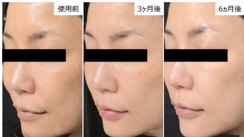
図2. 安全性確認を主目的とした長期使用試験での代表例 「全体のトーンが明るくなり、くすみが取れてきた気がする。頬のシミも薄くなった。」(使用中アンケートでのコメントより)