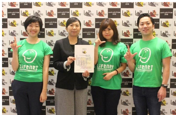
10月11日に開催されたwwPセミナー(当社人事担当者、ダイバーシティチームメンバー)

当社は153企業・団体の応募がある中で、5点満点の最高評価である「ゴールド」の評価を3年連続で獲得しました。